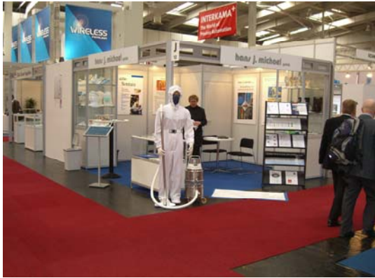
Unser Messestand auf der Hannover Messe 2008