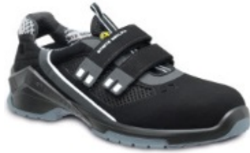
VD PRO 1010 ESD Art.-Nr.: RSVDPRO1010SER