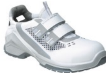
VD PRO 3070 ESD Art.-Nr.: RSVDPRO3070SER